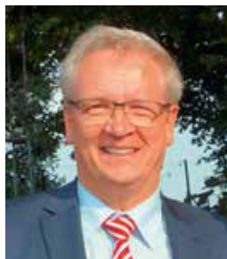
Josef Benner, Dr. Fraund Verlag